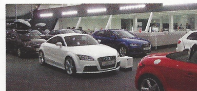
Audi Zentrum Leipzig Nord, Innenfoto