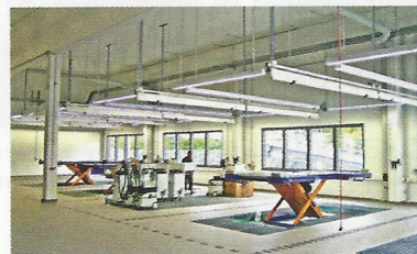
Karosserie- und Lackzentrum, Berlin-Tempelhof