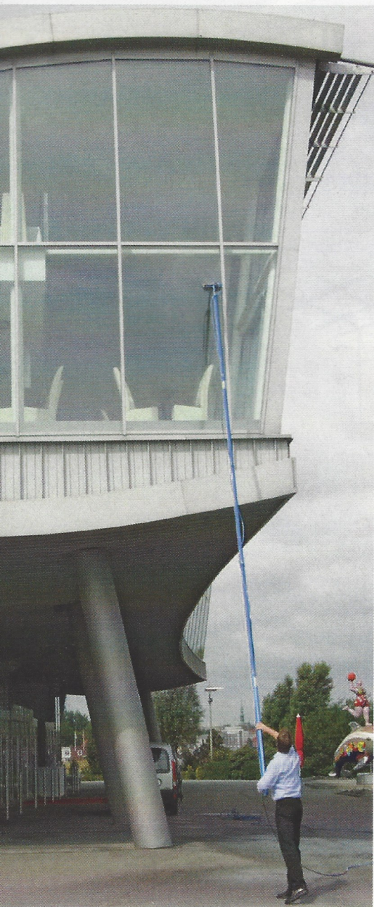
Schwere Aufgabe, gute Lösung: Chemielose Reinigung von Fenster und Fassade durch entmineralisiertes Wasser; mit diesem System können Flächen bis 15 m Höhe ganz ohne Hebebühne gereinigt werden.

GEBÄUDEBEWIRTSCHAFTUNG – Hier schlummern große Optimierungs- und Einsparpotenziale im Autohaus, speziell im Bereich der Gebäudereinigung.