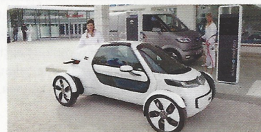
E-Mobility Tankstelle, Wolfsburg